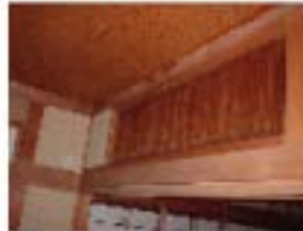
横間、垂壁にマゼラン設置