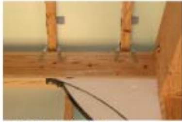
マゼラン取付部拡大